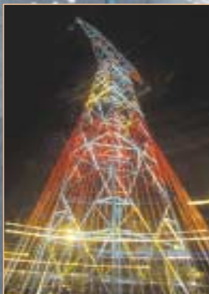
↑ Pylône n°12 - Source énergie photo - RTE