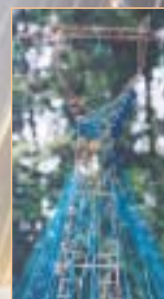
↑ « Maquette »