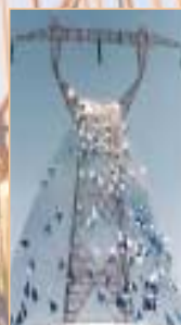
↑ « Pluie »