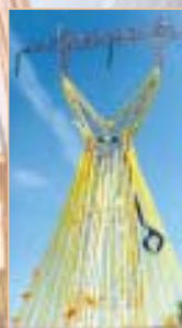
↑ « Source »