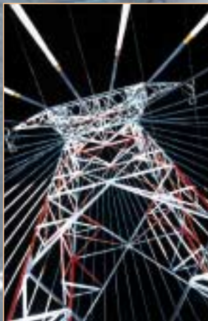
↑ Pylône n°11 - Source eau (hauteur 28 m)